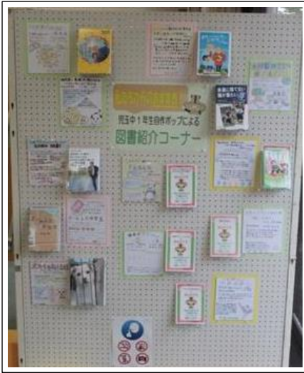
児玉分館の特設コーナーに展示された

9月号…「児玉中学校とのコラボ企画進行中！！」 10月号…「児玉中学校とのコラボ企画 中学生製作のポップを展示します！」 11月号…「2017 児玉分館 秋の読書週間企画 中学生おすすめの本、展示中です」